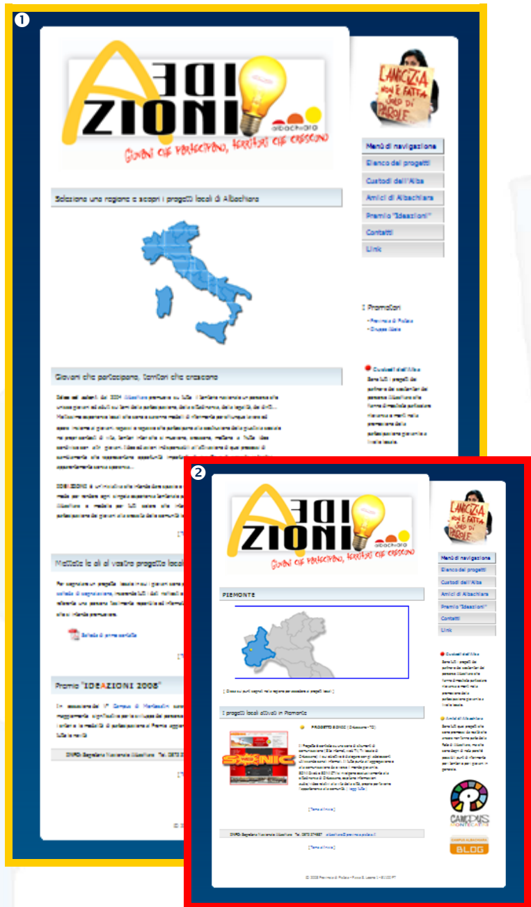
Nelle figure sopra: 1) la pagina iniziale del futuro sito "Ideazioni", con la pianta dell'Italia cliccabile per accedere alle sezioni regionali in cui verranno inseriti i progetti locali; 2) Esempio di una sezione con l'indicazione grafica della regione di riferimento e l'elenco dei singoli progetti locali presenti: ad ognuno di questi sarà dedicata una pagina con tutte le info, i materiali scaricabili, i link, ecc.

IDEAZIONI SUL WEB - Una volta pervenute le schede delle singole iniziative, la Segreteria Nazionale contatterà i referenti per richiedere tutto il materiale (loghi, fotografie, video, ecc.) necessario alla costruzione delle pagine web dedicate ai singoli progetti locali. Ognuno di questi verrà inserito in una mappa virtuale all'interno del sito www.campusmontecatini.it ed avrà a disposizione una pagina dove inserire tutte le informazioni utili non solo a conoscere l'iniziativa, ma anche ad interagire per eventuali scambi tra giovani, trasmissione di documenti, condivisione di idee, ecc. con tutti gli altri nodi della rete.